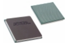
EP3SE110F780I3 Altera IC FPGA 488 I/O 780FBGA