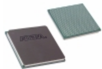
EP3SE110F780I4LN Altera IC FPGA 488 I/O 780FBGA