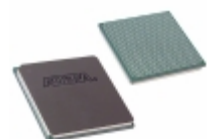
EP3SE110F780C4LN Altera IC FPGA 488 I/O 780FBGA