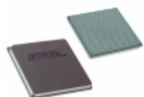
EP3SE110F780I3N Altera IC FPGA 488 I/O 780FBGA