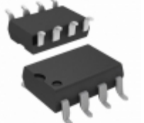
HCPL-4701#520 Broadcom Limited OPTOISO 5KV DARL 8-DIP GULL WING