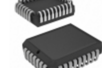
AT49F002T-70JI Microchip Technology IC FLASH 2MBIT 70NS 32PLCC