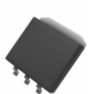
MIC37150BM TR Microchip Technology IC REG LDO ADJ 1.5A SPAK-3