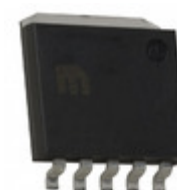
MIC37151-1.65BR Microchip Technology IC REG LDO 1.65V 1.5A SPAK-5