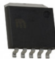
MIC37151-1.5WR Microchip Technology IC REG LDO 1.5V 1.5A SPAK-5