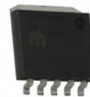
MIC37151-1.65BR TR Microchip Technology IC REG LDO 1.65V 1.5A SPAK-5