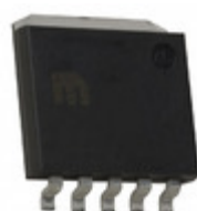
MIC37151-1.5BR TR Microchip Technology IC REG LDO 1.5V 1.5A SPAK-5