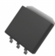
MIC37150BM Microchip Technology IC REG LDO ADJ 1.5A SPAK-3