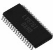
LV8761V-MPB-E ON Semiconductor IC MOTOR DRIVER PAR 36SSOP