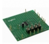
LV8761VGEVB AMI Semiconductor / ON Semiconductor BOARD EVAL FOR LV8761V