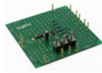
LV8760TGEVB AMI Semiconductor / ON Semiconductor BOARD EVAL FOR LV8760T