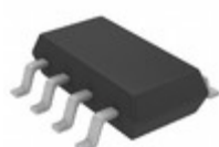
LTC2950CTS8-2#TRMPBF ADI (Analog Devices, Inc.) IC PB ON/OFF CONTROLLER TSOT23-8