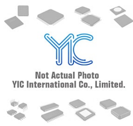
AD8667ARMZ-REEL7 ADI AD8667ARMZ-REEL7 ADI