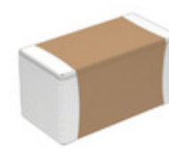
VJ1206A471JXEAP Electro-Films (EFI) / Vishay CAP CER 470PF 500V COG/NPO 1206