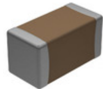
VJ1206A471JXGAT5Z Vishay Vitramon CAP CER 470PF 1KV COG/NPO 1206