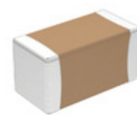
VJ1206A471JXCMT Electro-Films (EFI) / Vishay CAP CER 470PF 200V COG/NPO 1206