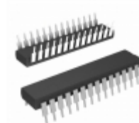
PIC16F767-I/SP Microchip Technology IC MCU 8BIT 14KB FLASH 28SDIP