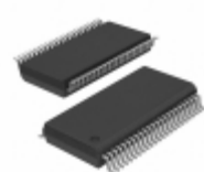
GTL2000DL,512 NXP Semiconductors / Freescale IC TRNSLTR BIDIRECTIONAL 48SSOP