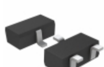
BD48K25G-TL Rohm Semiconductor IC DETECTOR VOLT 2.5V OD SSOP3