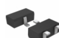
BD48K26G-TL Rohm Semiconductor IC DETECTOR VOLT 2.6V OD SSOP3