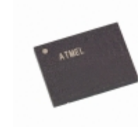
AT45DB321C-CNU Microchip Technology IC FLASH 32MBIT 40MHZ 8CASON