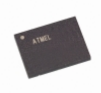
AT45DB321C-CNC Microchip Technology IC FLASH 32MBIT 40MHZ 8CASON