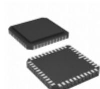
AT28HC256F-70LI Microchip Technology IC EEPROM 256KBIT 70NS 44CLCC