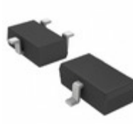
2SD2670TL Rohm Semiconductor TRANS NPN 12V 3A TSMT3