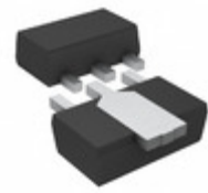
2SD2661T100 Rohm Semiconductor TRANS NPN 12V 2A MPT3