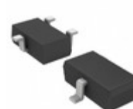
2SD2657TL Rohm Semiconductor TRANS NPN 30V 1.5A TSMT 3