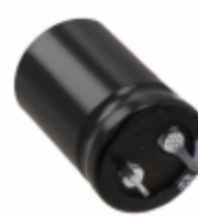
ECO-S2GP680AA Panasonic Electronic Components CAP ALUM 68UF 20% 400V SNAP