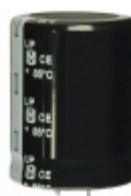
ECO-S2GP561EX Panasonic Electronic Components CAP ALUM 560UF 20% 400V SNAP