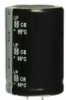
ECO-S2GP561EA Panasonic Electronic Components CAP ALUM 560UF 20% 400V SNAP