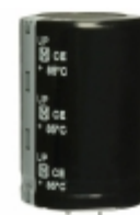
ECO-S2GP681EX Panasonic Electronic Components CAP ALUM 680UF 20% 400V SNAP