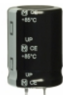
ECO-S2HP101CA Panasonic Electronic Components CAP ALUM 100UF 20% 500V SNAP