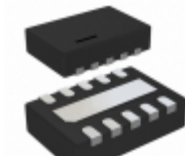
LTC2919IDDB-3.3#TRMPBF Linear Technology IC MONITOR PREC 3.3V 10-DFN