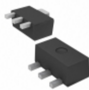
AP1115AY30L-13 Diodes Incorporated IC REG LDO 3V 0.6A SOT89-3