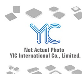
AP1115AY33LA ANACHIP AP1115AY33LA ANACHIP