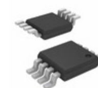
MIC5236-5.0YMM Microchip Technology IC REG LDO 5V 0.15A 8MSOP