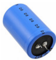
MAL215969151E3 Electro-Films (EFI) / Vishay CAP ALUM 150UF 20% 500V SNAP