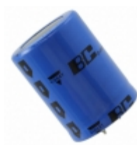
MAL215972102E3 Vishay BC Components CAP ALUM 1000UF 20% 200V SNAP