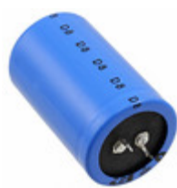
MAL215969221E3 Electro-Films (EFI) / Vishay 220F 500V 35X35MM 105C 5000H