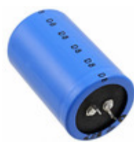
MAL215969689E3 Electro-Films (EFI) / Vishay 68F 500V 25X30MM 105C 5000H