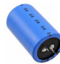
MAL215969181E3 Electro-Films (EFI) / Vishay 180F 500V 30X40MM 105C 5000H