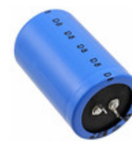
MAL215969271E3 Electro-Films (EFI) / Vishay 270F 500V 35X40MM 105C 5000H