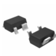
S-80819CLNB-B6ET2G SII Semiconductor Corporation IC VOLT DETECTOR 1.9V SC-82AB