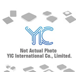
S-80819CLMC-B6E-T2 SEK S-80819CLMC-B6E-T2 SEK