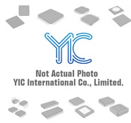
BU29503KVT-E2 ROHM ROHM TQFP