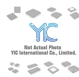
IRFP250. Original IRFP250. Original