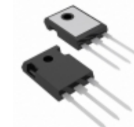
IRFP250PBF Vishay Siliconix MOSFET N-CH 200V 30A TO-247AC