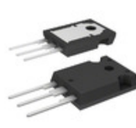
IRFP250 STMicroelectronics MOSFET N-CH 200V 33A TO-247