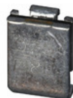
MF-SM260-2 Bourns Inc. FUZE RESETTABLE 2.6A HOLD SMD