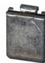
MF-SM300-2 Bourns Inc. FUZE RESETTABLE 3.0A HOLD SMD