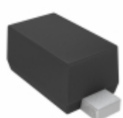
VDZT2R11B Rohm Semiconductor DIODE ZENER 11V 100MW VMD2