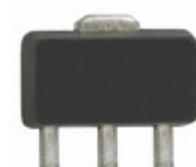
SBB-2089Z RF Solutions IC AMP HBT 850MHZ SOT-89