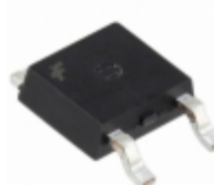
MC7810ECDTXM Fairchild/ON Semiconductor IC REG LDO 10V 1A TO252-3