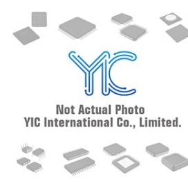
M74HC165B1 ST M74HC165B1 ST