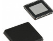
CY7C68301B-56LFXC Cypress Semiconductor Corp IC USB 2.0 BRIDGE AT2LP 56VQFN