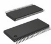
CY7C68301B-56PVXC Cypress Semiconductor Corp IC USB 2.0 BRIDGE AT2LP 56-SSOP