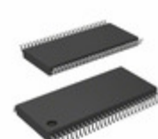
CY7C68301C-56PVXC Cypress Semiconductor Corp IC USB 2.0 BRIDGE AT2LP 56-SSOP