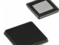
CY7C68301C-56LFXC Cypress Semiconductor Corp IC USB 2.0 BRIDGE AT2LP 56VQFN