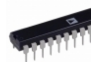
AD7948BN Analog Devices Inc. IC DAC 12BIT MULT PARALL 20-DIP