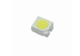
CLA2A-WKW-CYAZ0343 Cree Inc. LED COOL WHITE DIFF 4PLCC SMD