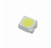
CLA2A-WKW-CYAZ0453 Cree Inc. LED COOL WHITE DIFF 4PLCC SMD