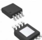
MIC5281-3.3YME Microchip Technology IC REG LDO 3.3V 25MA 8MSOP