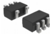
M74VHC1GU04DFT2G ON Semiconductor IC INVERTER SGL UNBUFFER SOT-353