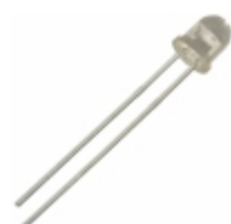
OP298A TT Electronics/Optek Technology EMITTER IR 875NM 100MA RADIAL