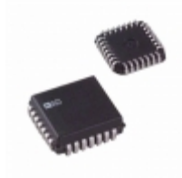
AD7245AAP Analog Devices Inc. IC DAC 12BIT W/REF 28-PLCC