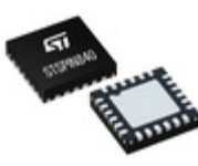
STSPIN840 STMicroelectronics COMPACT DUAL BRUSHED DC MOTOR DR