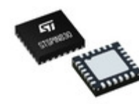
STSPIN830 STMicroelectronics COMPACT AND VERSATILE THREE-PHAS