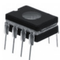
PIC12C671/JW Microchip Technology IC MCU 8BIT 1.75KB EPROM 8CDIP