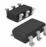
AP3783BK6TR-G1 Diodes Incorporated IC REG CTRLR AC/DC GEN3 SOT26