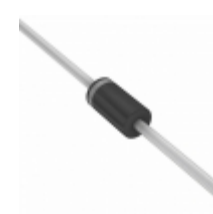
1N4750A-TR Electro-Films (EFI) / Vishay DIODE ZENER 27V 1.3W DO41