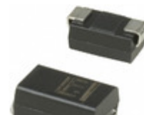
SMAJ78 Littelfuse Inc. TVS DIODE 78VWVM 132.3VC SMA