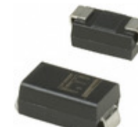
SMAJ78A Littelfuse Inc. TVS DIODE 78VWVM 126VC SMA