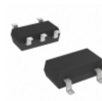
MIC5366-2.6YC5-TR Microchip Technology IC REG LDO 2.6V 0.15A SC70-5