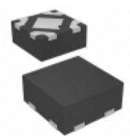
MIC5366-2.6YMT-TR Microchip Technology IC REG LDO 2.6V 0.15A 4TMLF