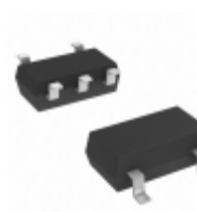
MIC5366-2.5YC5-TR Microchip Technology IC REG LDO 2.5V 0.15A SC70-5