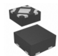
MIC5366-2.5YMT-TR Microchip Technology IC REG LDO 2.5V 0.15A 4TMLF