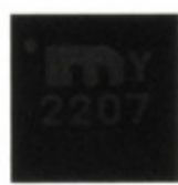
MIC2207YML-TR Microchip Technology IC REG BUCK ADJ 3A 12MLF