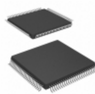
ATMEGA1280R212-AU Microchip Technology IC RF TXRX+MCU 802.15.4 100- TQFP