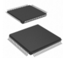
ATMEGA1280R231-AU Microchip Technology IC RF TXRX+MCU 802.15.4 100- TQFP