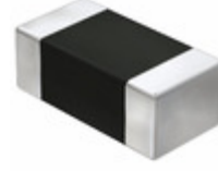
JMK325C7107MM-T Taiyo Yuden CAP CER 100UF 6.3V X7S 1210