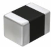
JMK432BJ107MU-T Taiyo Yuden CAP CER 100UF 6.3V X5R 1812