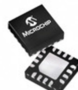
PIC16LF15325T-I/JQ Microchip Technology IC MCU 8-BIT 14KB FLASH 16UQFN