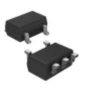
S-1000N26-M5T1G SII Semiconductor Corporation IC VOLT DETECT N-CH 26V SOT23-5