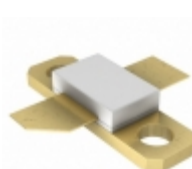
MRFE6VS25LR5 NXP USA Inc. FET RF 133V 512MHZ NI360L