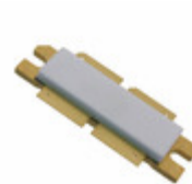
MRFE6VP8600HR6 NXP USA Inc. FET RF 2CH 130V 860MHZ NI1230H