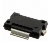
MRFE6VS25GNR1 NXP USA Inc. FET RF 133V 512MHZ TO-270-2