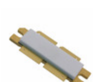
MRFE6VP8600HR5 NXP USA Inc. FET RF 2CH 130V 860MHZ NI-1230