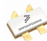
MRFE6VP6300HSR5 NXP USA Inc. FET RF 2CH 130V 230MHZ NI780S-4