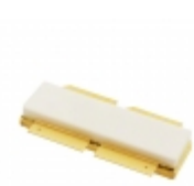
MRFE6VP8600HSR5 NXP USA Inc. FET RF 2CH 130V 860MHZ NI1230S