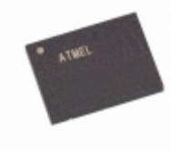
AT45DB161B-CNC-2.5 Microchip Technology IC FLASH 16MBIT 15MHZ 8CASON