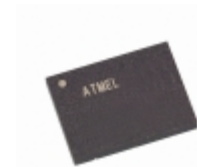
AT45DB161B-CNI Microchip Technology IC FLASH 16MBIT 20MHZ 8CASON