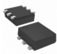
MTM867270LBF Panasonic Electronic Components MOSFET N-CH 20V 2.2A WSSMINI6