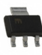
MIC5200-3.0YS Microchip Technology IC REG LDO 3V 0.1A SOT223