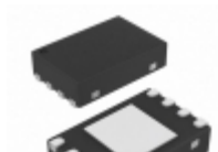
SST25PF020B-80-4C-QAE Microchip Technology IC FLASH 2MBIT 80MHZ 8WSO